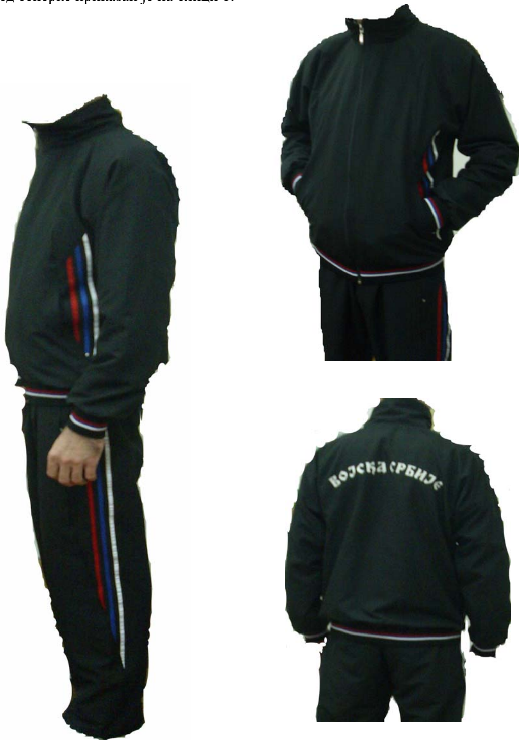
Слика 1 – Изглед тенераке