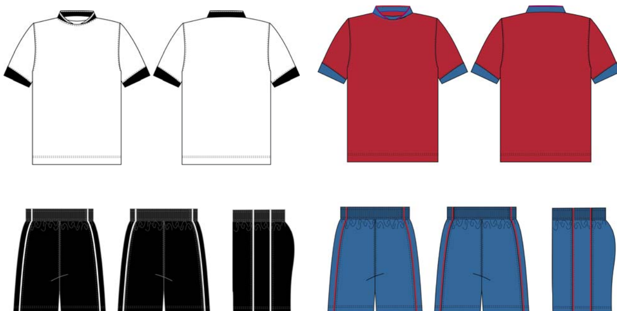
Слика 1 – Изглед и комбинације боја мајица спортских и шорцева спортских (од синтетичке плетенине)

Спољни изглед Мајице спортске и шорца спортског и комбинације боја, приказани су на слици 1.